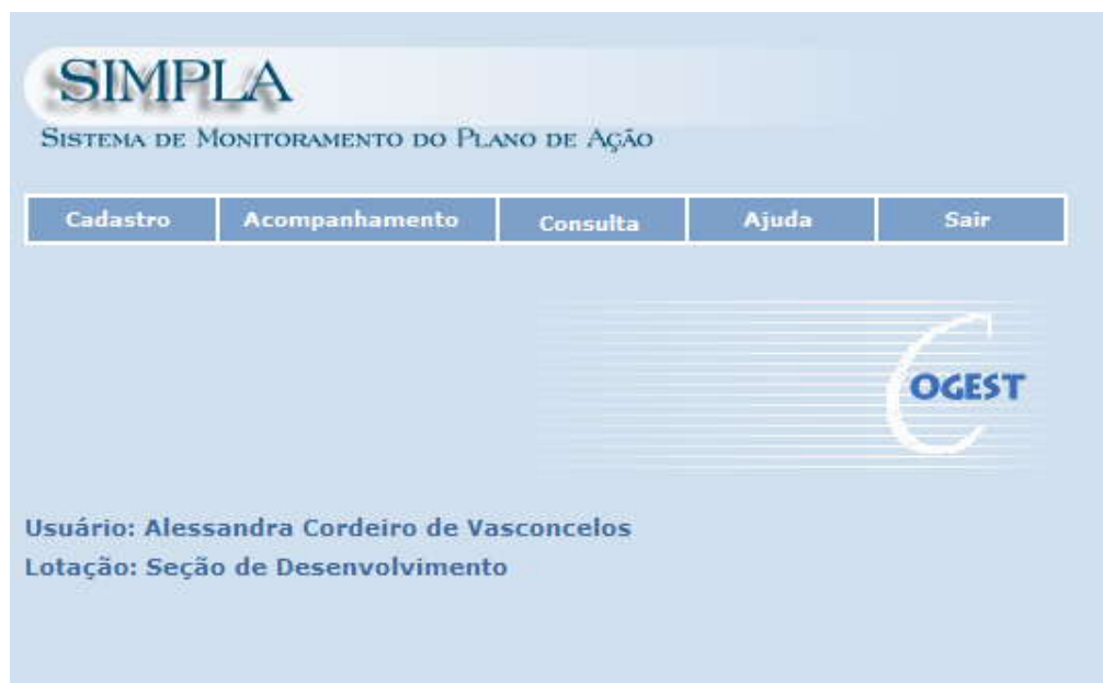
Figura 2 – Tela inicial do SIMPLA

As funcionalidades do SIMPLA estão organizadas em 3 menus: Cadastro, Acompanhamento e Consulta. A figura 2, a seguir, ilustra a tela inicial do SIMPLA.